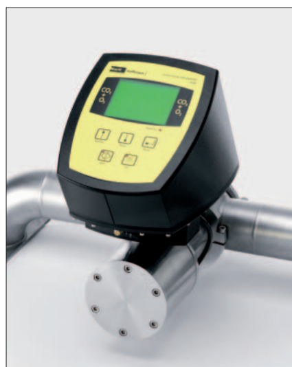
Los equipos de medición se caracterizan por bajos gastos de calibración y mantenimiento.

Por ser el valor DO (oxígeno disuelto) en las bebidas uno de los parámetros más importantes, las instancias que aseguran la calidad, como por ejemplo ISO, establecen controles sistemáticos de la exactitud de la medición. Tanto el punto cero como el mayor punto de calibración permiten ser calibrados rápida y sencillamente sin desmontar el sensor de O 2 . El gasto de mantenimiento es por tanto muy bajo.